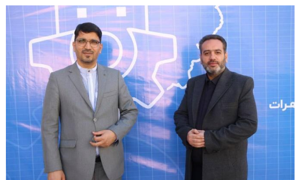
چهارمین رویداد آموزشی کیان گستر با همکاری مرکز فرهنگی جمهوری اسلامی ایران در هرات برگزار شد.